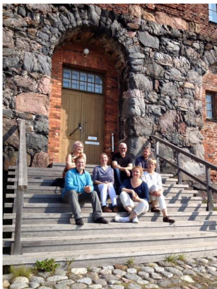
Filantropian hallitus ja työntekijät kokoontuivat elokuussa 2016 Suomenlinnaan suunnittelutyöhön.